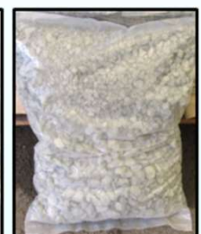
(1) APJ-150バインダー (2) MM-DS専用骨材 APJ-150バインダー(Ⅱ型)