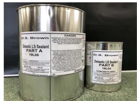
特殊ウレタン樹脂材料(Ⅰ型)