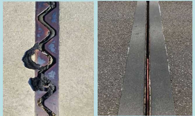
遊間部のゴム劣化の状況