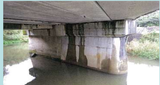
遊間部からの漏水状況