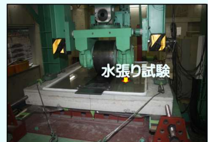
輪荷重走行試験機

○補修厚40mm以下の薄層補修には低弾性のリフレモルセット、40mm以上の補修厚にはリフレモルセットに小粒径骨材を配合した低弾性コンクリートが適しております。