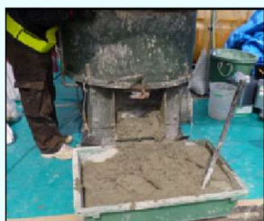
(5) リフレモルセット練り混ぜ