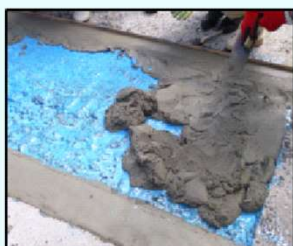
(6) モルタル打ち込み