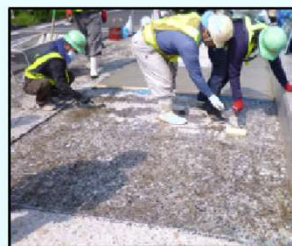
(3) 浸透性KSプライマー塗布