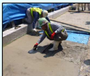
(7) 部分補修による表面仕上げ