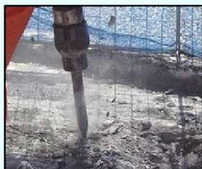
(2) アスファルト舗装撤去