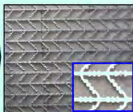
グリッドメタル筋 展張加工