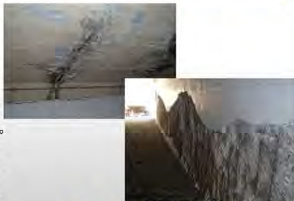
ボックスカルバートの損傷