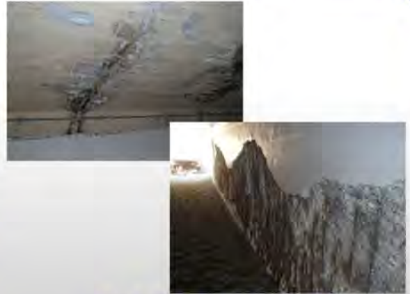
ボックスカルバートの損傷